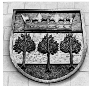
Wappen vorm Ratssaal im Rathaus Kronshagen

F.P. Sehr geehrte Leserschaft, in diesem Newsletter möchte ich euch meine Arbeit als ihr Gemeindevertreter nahe bringen und damit auch Fakten über Kronshagen antragen. Diesen Newsletter bezahle ich selbst von meinen spärlichen Sitzungsgeldern. Ich verkaufe keine Anzeigen und nehme keine Weisungen Dritter entgegen. Die gesamte Arbeit für den Satz, das Zusammensuchen der Fakten und das Schreiben der Texte (korrigieren lasse ich) mache ich selbst neben den Sitzungen. Trotz großer Mühe können sich immer Fehler einschleichen.<!-- am Anfang und --> am Ende rahmen meine Kommentare ein.